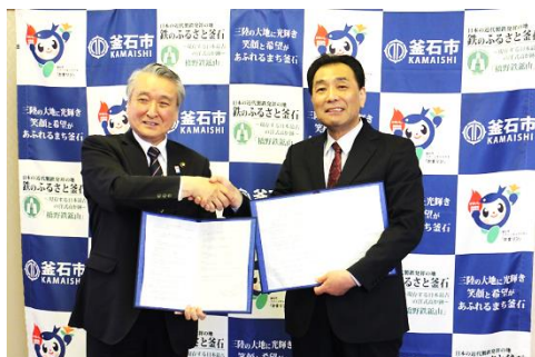
左：野田市長 右：川村社長